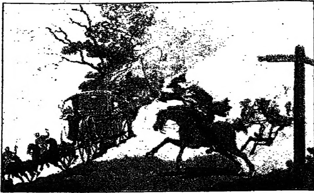
العروسان الهاربتان في العربة الامامية والاب خلفهما يهدد ويتوعد...